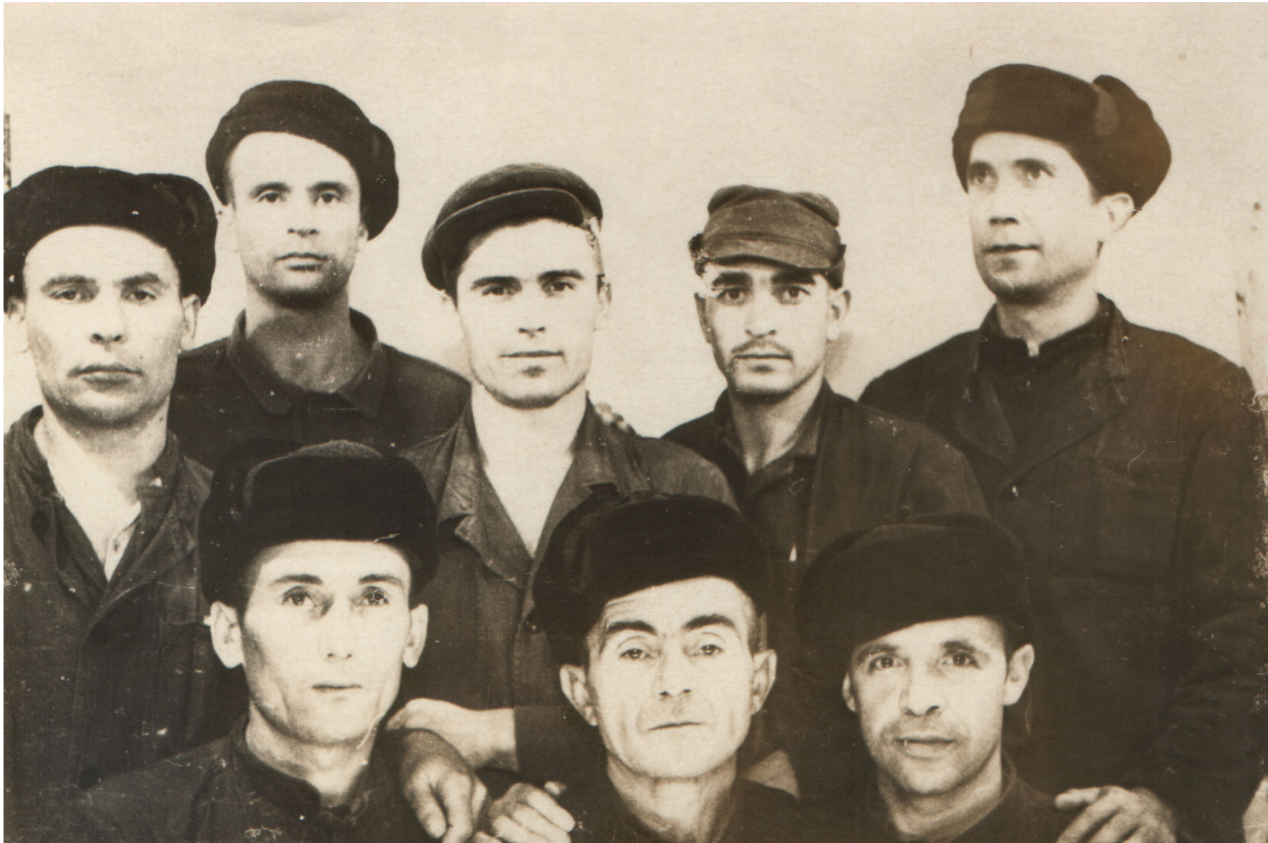
Ташкент. 1969 рік. Кримські татари – підсудні на Ташкентському процесі за участь в національному русі. Всі вони були притягнені до кримінальної відповідальності за звинуваченням в розповсюдженні "свідомо помилкових вигадок, що порочать радянський державний і суспільний устрій".