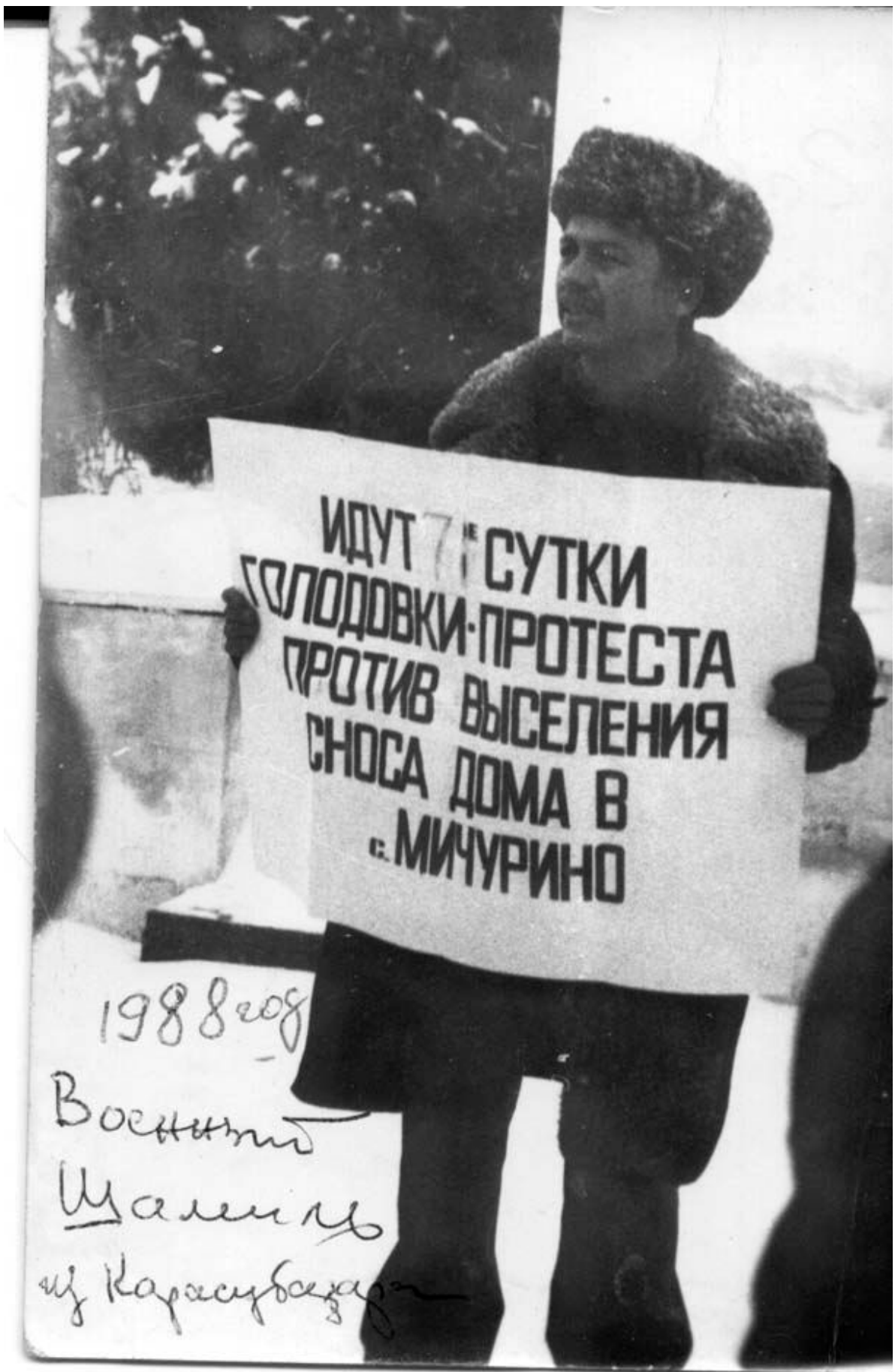
Крим, Білогірськ, 1988 рік. Важка дорога додому. Кримські власті чинять опір поверненню кримських татар на Батьківщину, руйнують їх домівки, осуджують за „порушення паспортного режиму”.