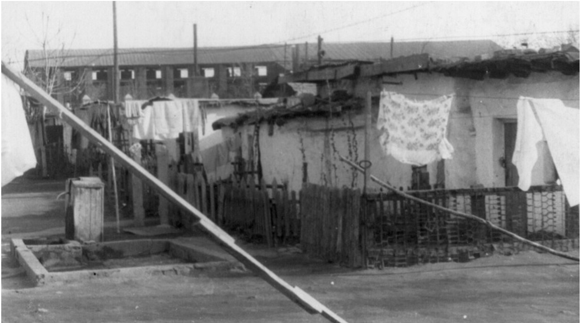
Ташкентська область, заводське селище Карборунд, 50-е роки. Одне з багатьох місць вимушеного мешкання кримськотатарських сімей в депортації.